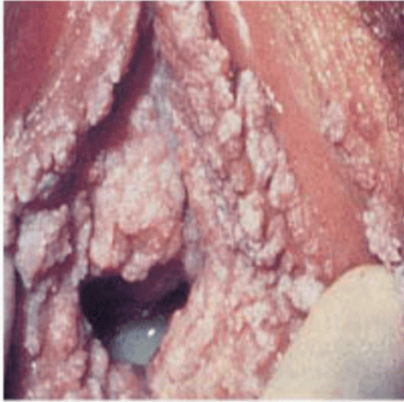
A زگیل تناسلی زنان