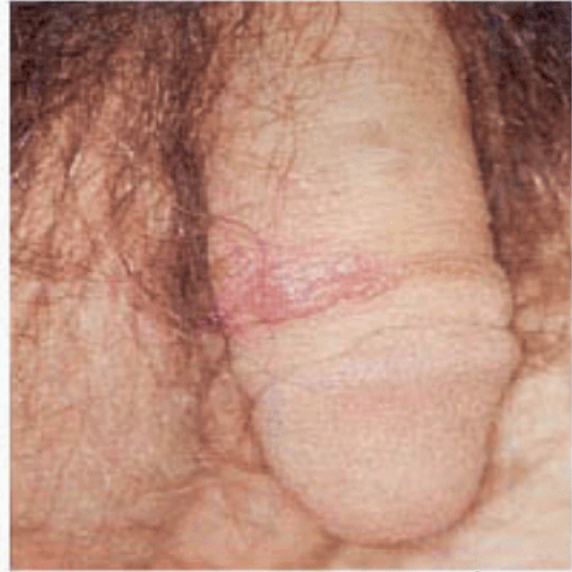
B زگیل تناسلی مردان